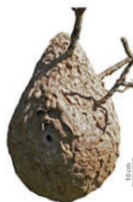
FRELON ASIATIQUE Vespa velutina